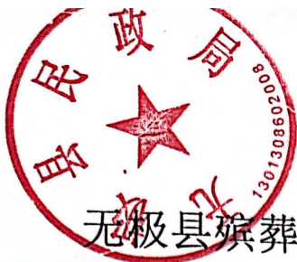
无极县殡葬服务收费价格一览表